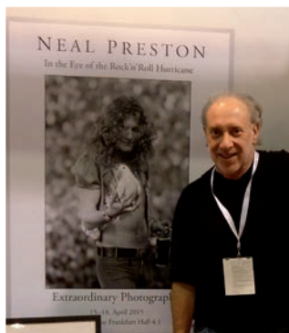
Neal Preston vor dem Plakat von „In the Eye of the Rock-‘n’-Roll-Hurricane“.

Ein ganz besonderes Highlight bietet die diesjährige Musikmesse, die vom 15. bis 18. April in Frankfurt am Main stattfindet: Im Rahmen der Sonderausstellung „In the Eye of the Rock-‘n’-Roll-Hurricane“ werden über 70 Fotos aus dem Werk des herausragenden Rock-Fotografen Neal Preston gezeigt. Preston begann in den späten 1960ern, den Rock ‘n’ Roll abzulichten und wurde in den 1970er-Jahren zu einem der führenden US-Rockmusik-Fotografen. Entscheidend für seinen Werdegang war die Band Led Zeppelin, die er 1970 erstmals fotografierte und 1975 auf Tour begleitete. Obwohl sein Name seither unauslöschlich mit Page, Plant, Jones und Bonham verknüpft ist, lichtete Preston im Laufe der Zeit unzählige weitere Bands und Solokünstler fotografisch ab – unter anderem The Who, Queen, Bruce Springsteen, U2, Michael Jackson und Whitney Houston. Darüber hinaus fotografierte er bei sechs Olympischen Spielen und zahlreichen weiteren Großveranstaltungen und fertigte Fotos für Filmproduktionen an. Die Sonderausstellung „In the Eye of the Rock-‘n’-Roll-Hurricane“ findet auf der Musikmesse in Halle 4.1 auf 1.000 Quadratmetern statt: Neben großformatigen Fotografien aus der „Lightpower Collection“ wurden 15 Stationen installiert, über die via Kopfhörer Infos zu den Exponaten abgerufen werden können. Auch Neal Preston selbst wird vor Ort anwesend sein und unter anderem „Fine Art Prints“ seiner Fotografien signieren.