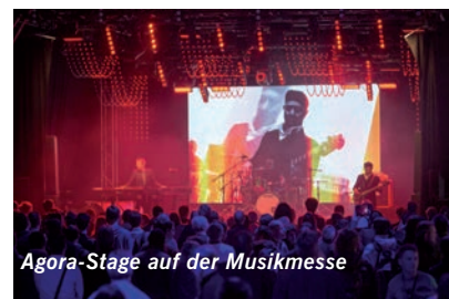
Agora-Stage auf der Musikmesse

Casio sucht gemeinsam mit der Booking-Plattform Gigmit.com den „Casio-Stagepiano-Act“ auf der Musikmesse 2015. Der Gewinnerband winkt ein Auftritt auf der Agora-Stage, der Hauptbühne der Musikmesse, vor versammeltem Fach-Publikum. Dazu spendiert Casio insgesamt drei Exemplare seines Stagepianos Privia Pro PX-5S. Gigmit versteht sich als „Marktplatz für Musik-Booking“ im Internet und funktioniert als Vermittlungsplattform zwischen Künstlern und Veranstaltern. Weitere Infos gibts unter www.casio-music.de und www.gigmit.com .