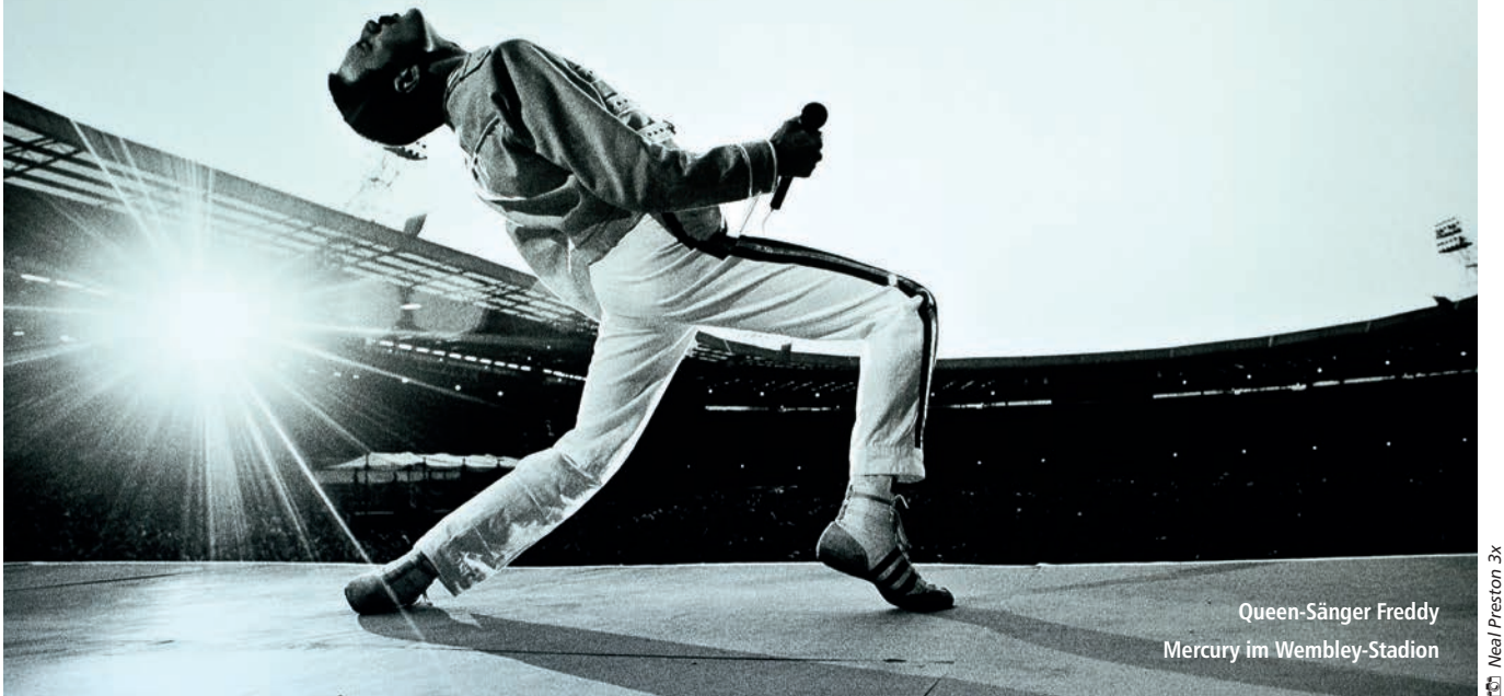
Queen-Sänger Freddy Mercury im Wembley-Stadion