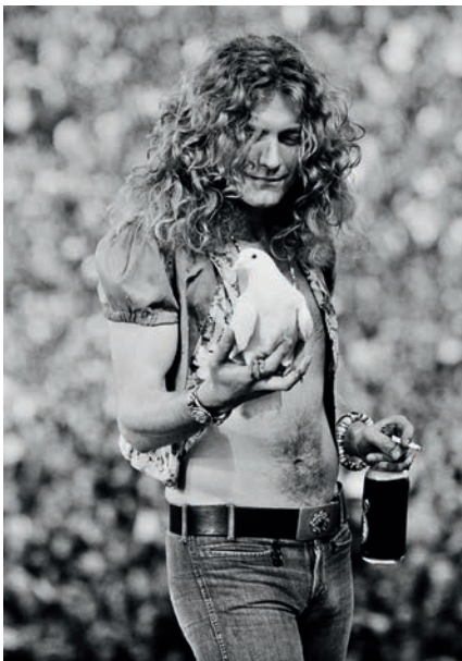
Robert Plant von Led Zeppelin 1973