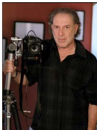
Musikfotograf Neal Preston

"Ungeschönte, ehrliche Fotos", sagt Ralph-Jörg Wezorke über die Aufnahmen - und nennt Prestons Erfolgsrezept: "Er arbeitet, als ob er nicht da ist. Neal Preston macht sich für die Künstler unsichtbar, sie spüren ihn nicht. Deshalb vergessen die Künstler auch, dass er in ihrem Umfeld ist, und deshalb kommt er auch so nah an sie ran." Nur so könnten solche Momentaufnahmen entstehen: "Die Fotos sind keine gecasteten Studioaufnahmen, mit denen eine bestimmte Wirkung erzielt werden soll. Der Künstler ist nicht verstellt."