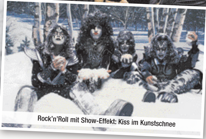
Rock'n'Roll mit Show-Effekt: Kiss im Kunstsnee

nichts mehr drüber. Von Angus bis Zappa hatte sie Neal alle vor der Linse. Zudem hat er viele davon auf langen Tournéeen im Flieger, im Hotel, backstage , auf der Bühne und manchmal sogar zu Hause mit seiner Kamera begleitet. Meiner Meinung nach hat Neal die DNA des Rock'n'Roll auf Film gebannt und führt uns damit in das Auge des Sturms. „In the Eye of the R'n'R Hurricane“ ist deshalb auch der Titel für Neals Gesamtwerk und gleichzeitig der inhaltliche Schwerpunkt der Lightpower Collection.