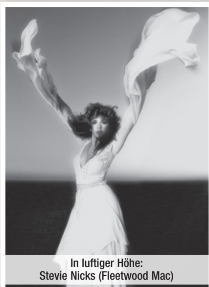
In luftiger Höhe: Stevie Nicks (Fleetwood Mac)

Sie liegen ganz klar in der Dokumentarfotografie. Aufnahmen, die weder gestellt noch inszeniert sind, die dafür aber das ganze Spektrum auf und hinter der Bühne wiedergeben. Das volle Leben und die Energie, aber auch die leisen Momente der Stars und manchmal auch deren Leiden. Genau hier war und ist Neal Preston so nahe dran wie nur wenige seiner Kollegen. Und das in einer Bandbreite, die kein zweiter Fotograf bislang erreicht hat und je erreichen wird. Wenn man wie er mit 16 Jahren schon Jimi Hendrix, Janis Joplin und die Doors fotografiert hat und danach 40 Jahre lang alles, was Rang und Namen hat, dann geht da einfach