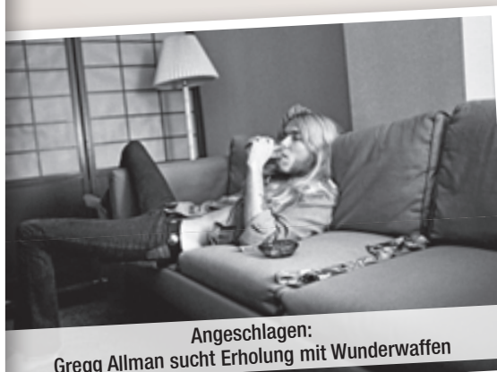
Angeschlagen: Gregg Allman sucht Erholung mit Wunderwaffen